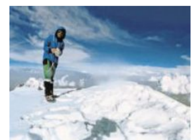
Reinhold Messner am Nanga Parbat.

Weiden. (sbö) Reinhold Messner, der als erster Mensch den Mount Everest ohne Sauerstoff bestieg und alle 14 Achttausender erklimmt, wird im Rahmen seiner letzten Tournee in Weiden auftreten. Am Dienstag, 18. November, um 19.30 Uhr, hält er in der Max-Reger-Halle seinen Vortrag „Über Leben“. Messner, mittlerweile 80 Jahre alt, wird über die Essenz seiner Lebenserfahrungen sprechen – über Mut, Leidenschaft und Verantwortung. Er behandelt zentrale Kapitel seines Lebens, von Heimat bis Tod, und zieht eine zutiefst persönliche Bilanz seiner spektakulären Abenteuer. Messner, der auch die größten Eis- und Sandwüsten der Erde zu Fuß durchquerte, sagt: „Immer, wenn es in meinem Leben besonders schwierig wurde, bin ich noch einen Schritt weiter gegangen, als ich es ohne Widerstände und Probleme getan hätte.“